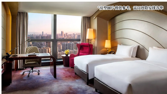
*房型圖片僅供參考，需以實際安排為準