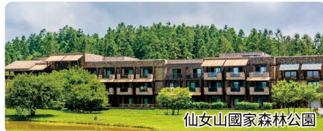
仙女山國家森林公園