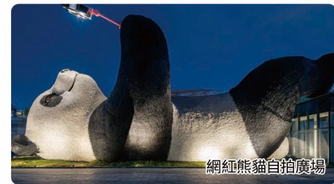
網紅熊貓自拍廣場